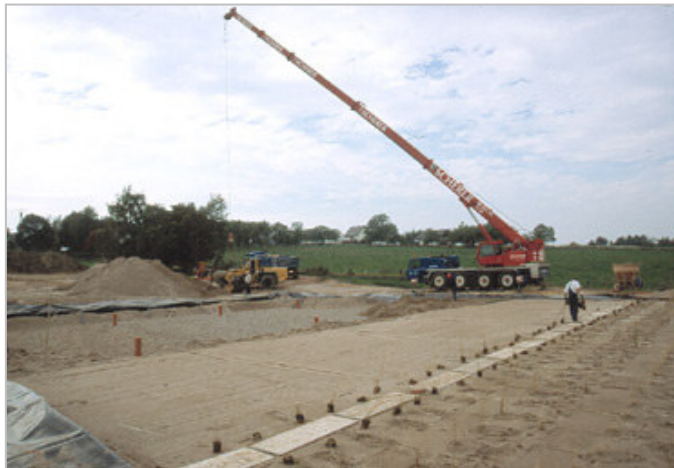
Der erste Bodenfilter im Bau - September 2001

In der Hunsrückgemeinde Dorweiler (350 Einwohner), Landkreis Simmern, Rheinland-Pfalz, wurde das Abwasser bis Anfang Oktober 2001 lediglich mechanisch in einem Emscherbecken gereinigt. Eine biologische Nachreinigung war dringend erforderlich.