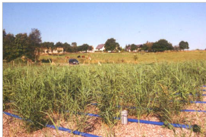
Anlagenstandort am Ortsrand - August 2002

Der vertikale Fließvektor des Abwassers durch den Bodenfilter sorgt für einen optimalen Sauerstoffeintrag und somit für eine ganzjährig hohe Reinigungsleistung. Das abfließende Wasser strömt klar und geruchsfrei in den naheliegenden Bach.