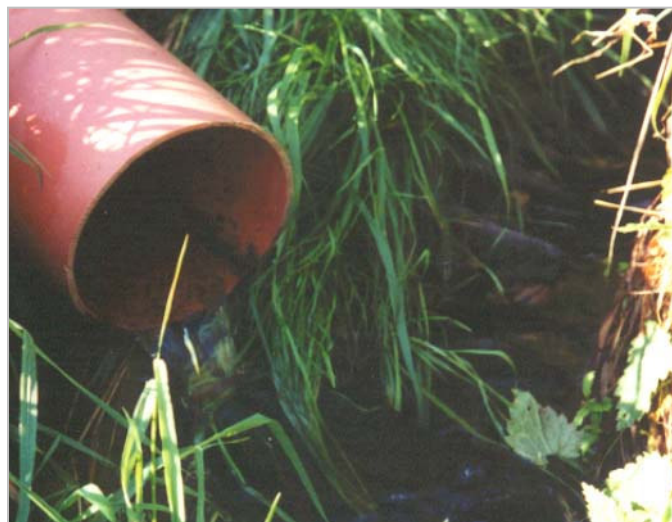
Das gereinigte Abwasser fließt glasklar in den Vorfluter